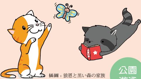
插圖：狼恩と黒い森の家族