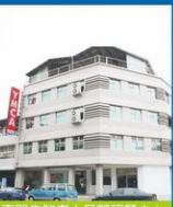
東門失智老人日間照顧中心