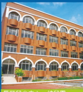
長榮兒少中心 - 幼兒園

台南市林森路二段79號 (06)2082517、2363005 FAX: 2369291