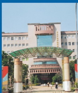
兒童福利服務中心