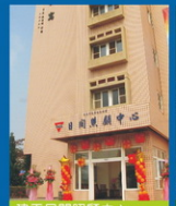
建平日間照顧中心