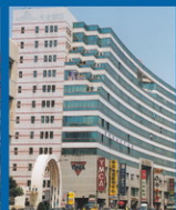
公善書院 - 幼兒園