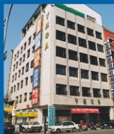
培遠書院 - 幼兒園