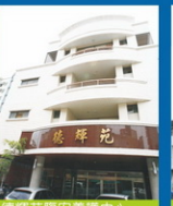
德輝苑臨安養護中心