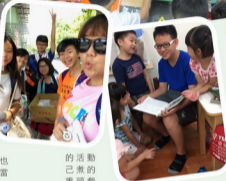
的活動 已煮的 畫頭戲 舞，最

我從幼兒園到現在都是在YMCA學習成長，這個暑假在YMCA認識了很多人，也學到了許多生活常識和做事的方法，如果下次還有機會，我一定再去當小志工。